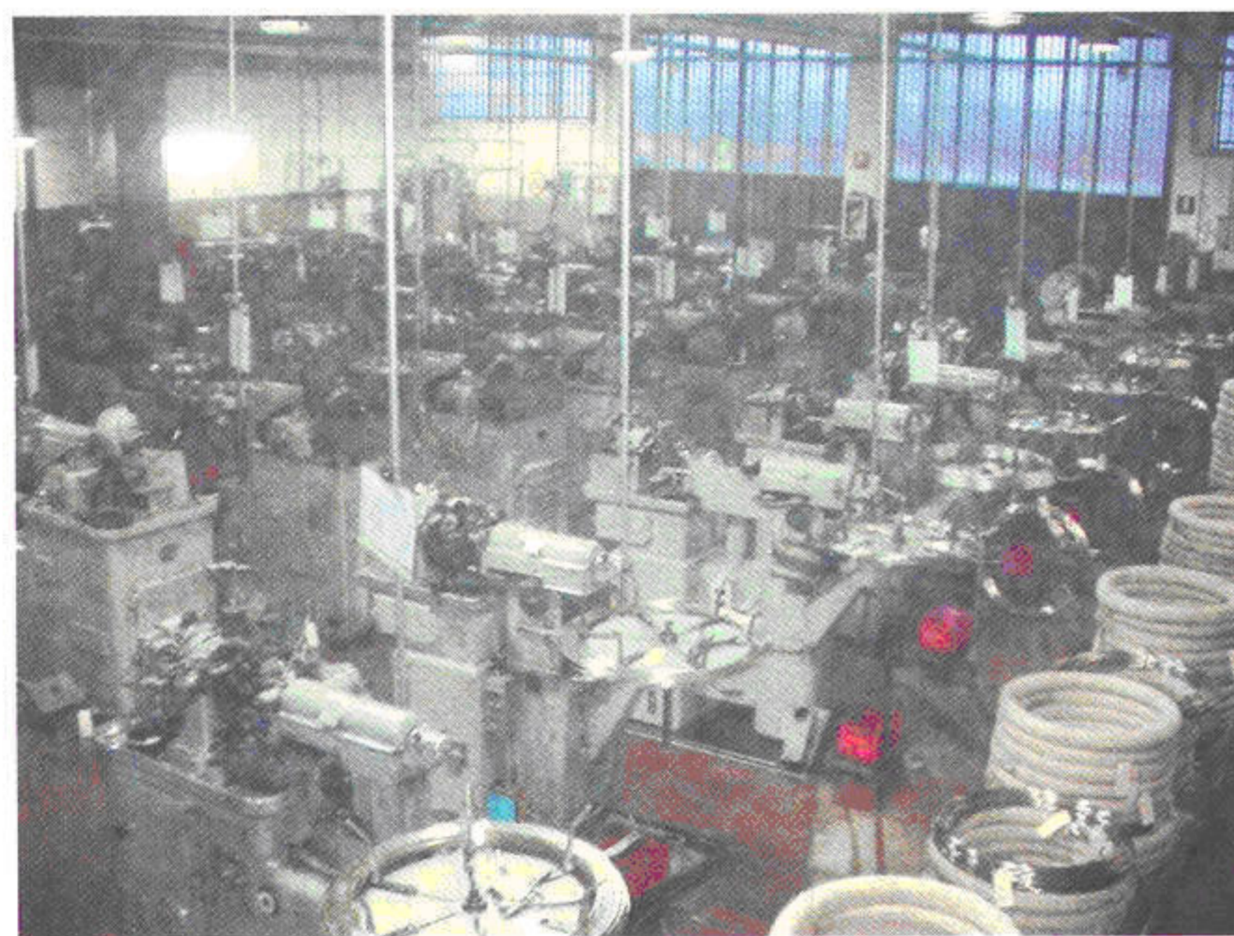
Vista interna dello stabilimento Deco. Inside view of Deco company.