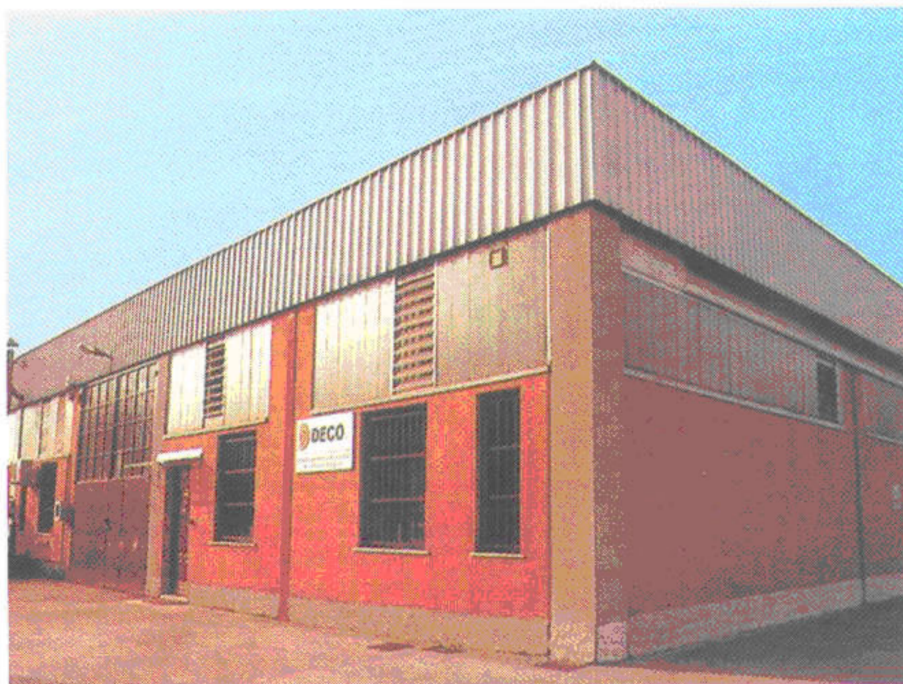
La sede Deco a Pieve Emanuele (MI). Deco site in Pieve Emanuele (MI).