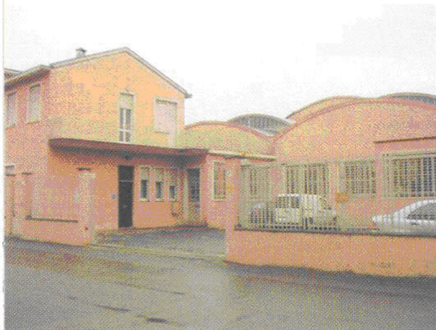
Veduta esterna dell'unità produttiva O.M.P. di Lodi (LO).

Items that once assembled can hardly be seen but that are fundamental for a vehicle functioning; the group product range consists of: tappets, bolts, screws, forks, clamps, joints and so on.