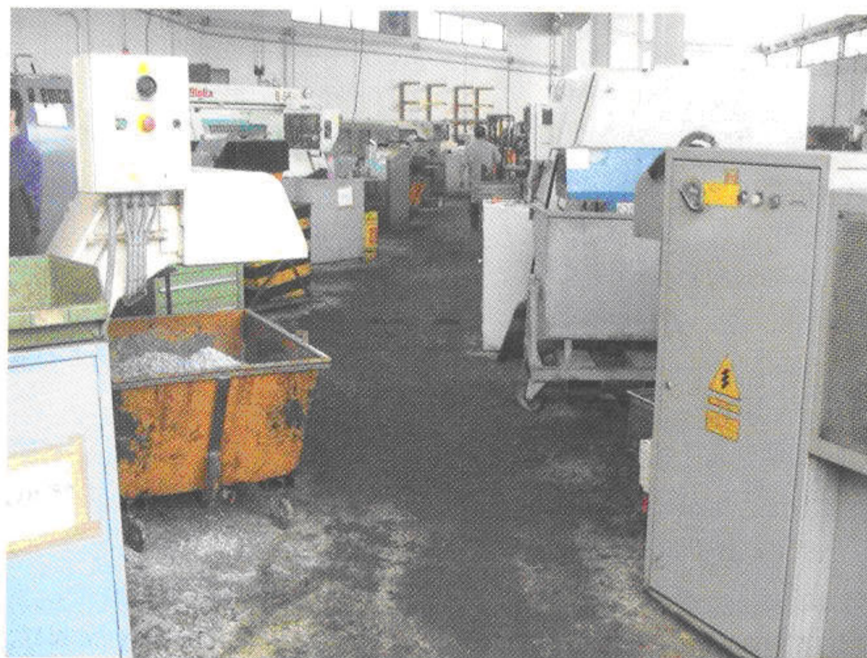
Vista interni dell'azienda O.M.P. Inside view of O.M.P. company.