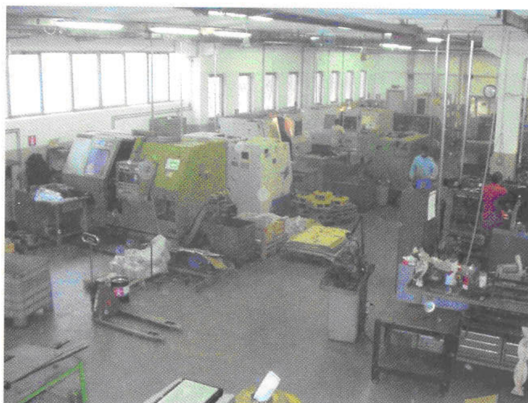
Reparto macchinari a controllo numerico (CNC) in O.M.G. CNC machinery department in O.M.G.