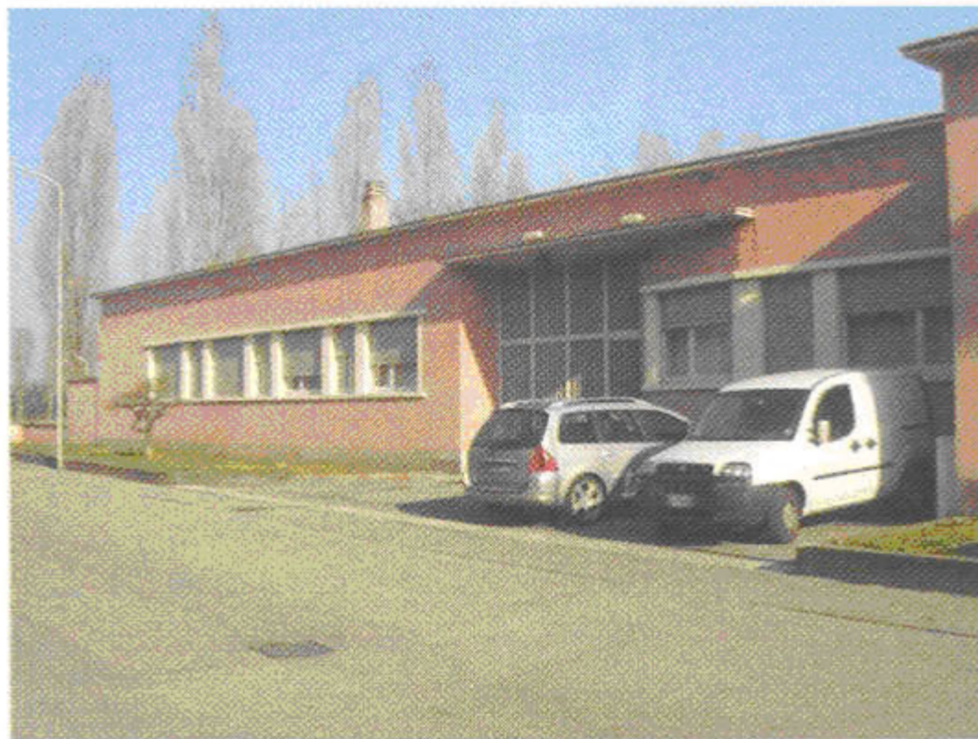
Vista esterna del magazzino O.M.P. di Lodi (LO).

External view of the O.M.P. production site in Lodi (LO).