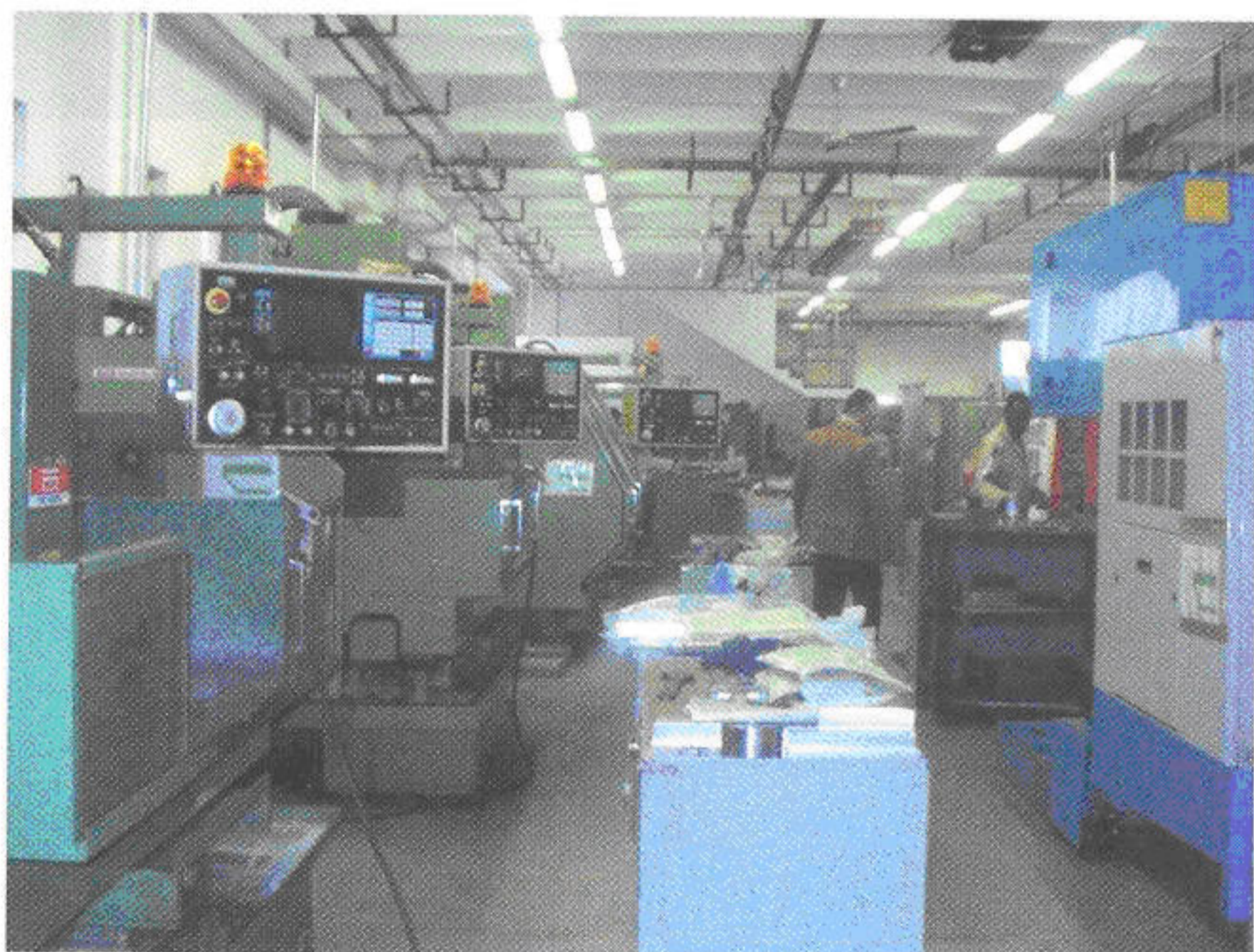
Reparto centro di lavoro O.M.G. A working department in O.M.G.