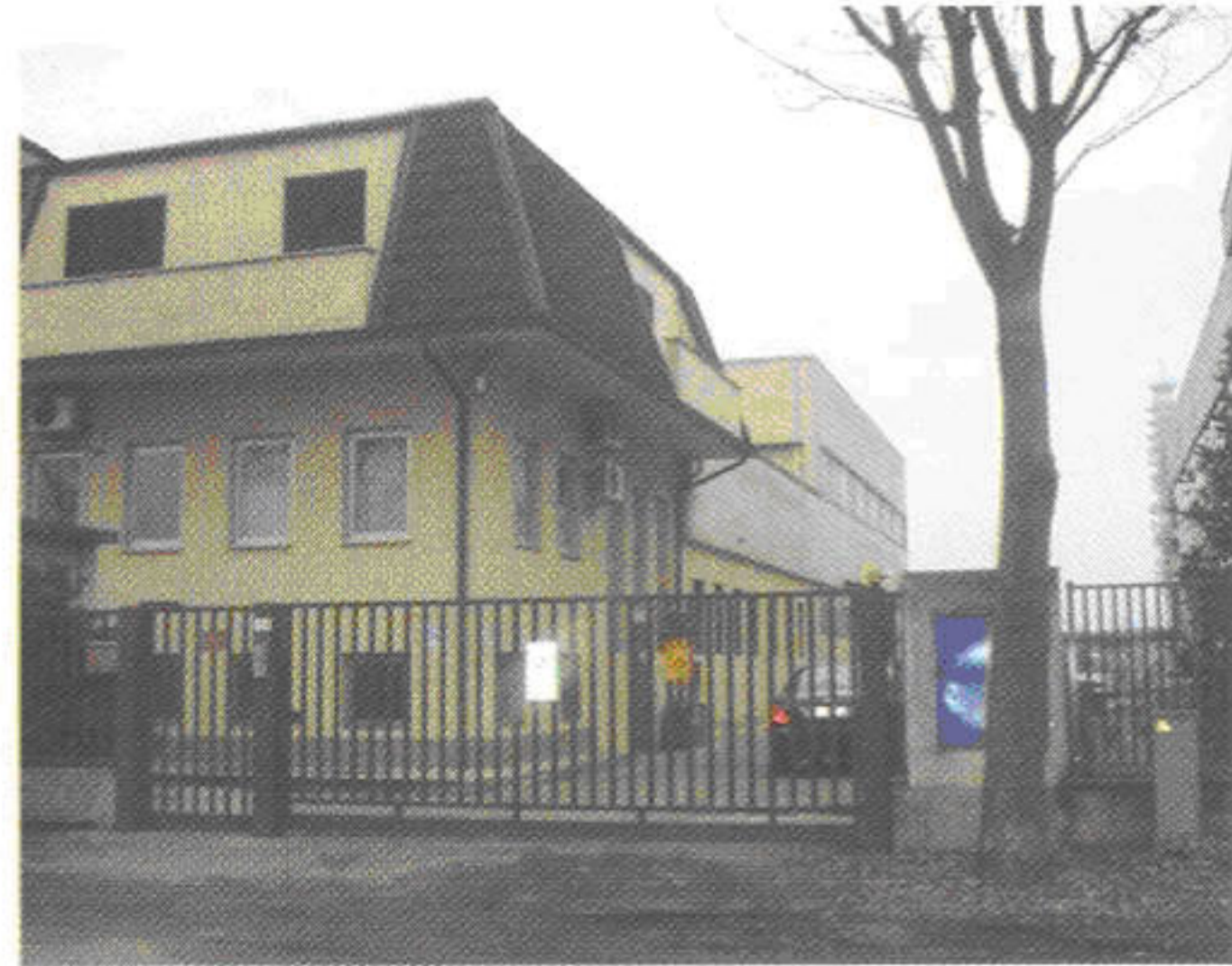
Stabilimento O.M.G. di Cernusco sul Naviglio (MI).

External view of the O.M.P. warehouse in Lodi (LO).