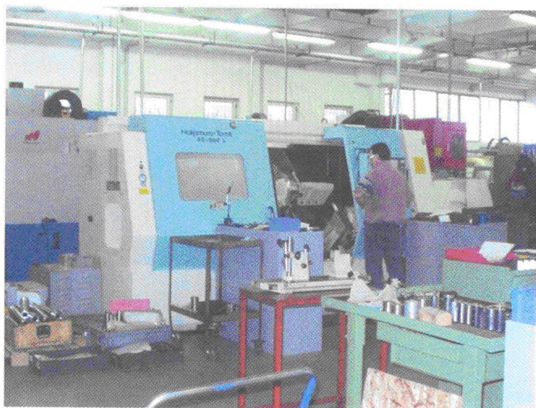
Fase di lavorazione nello stabilimento Vergani. A working phase in Vergani factory.

di piccole dimensioni per grandi quantitativi quali spine, perni, eccetera, per apparati elettronici e meccanici.