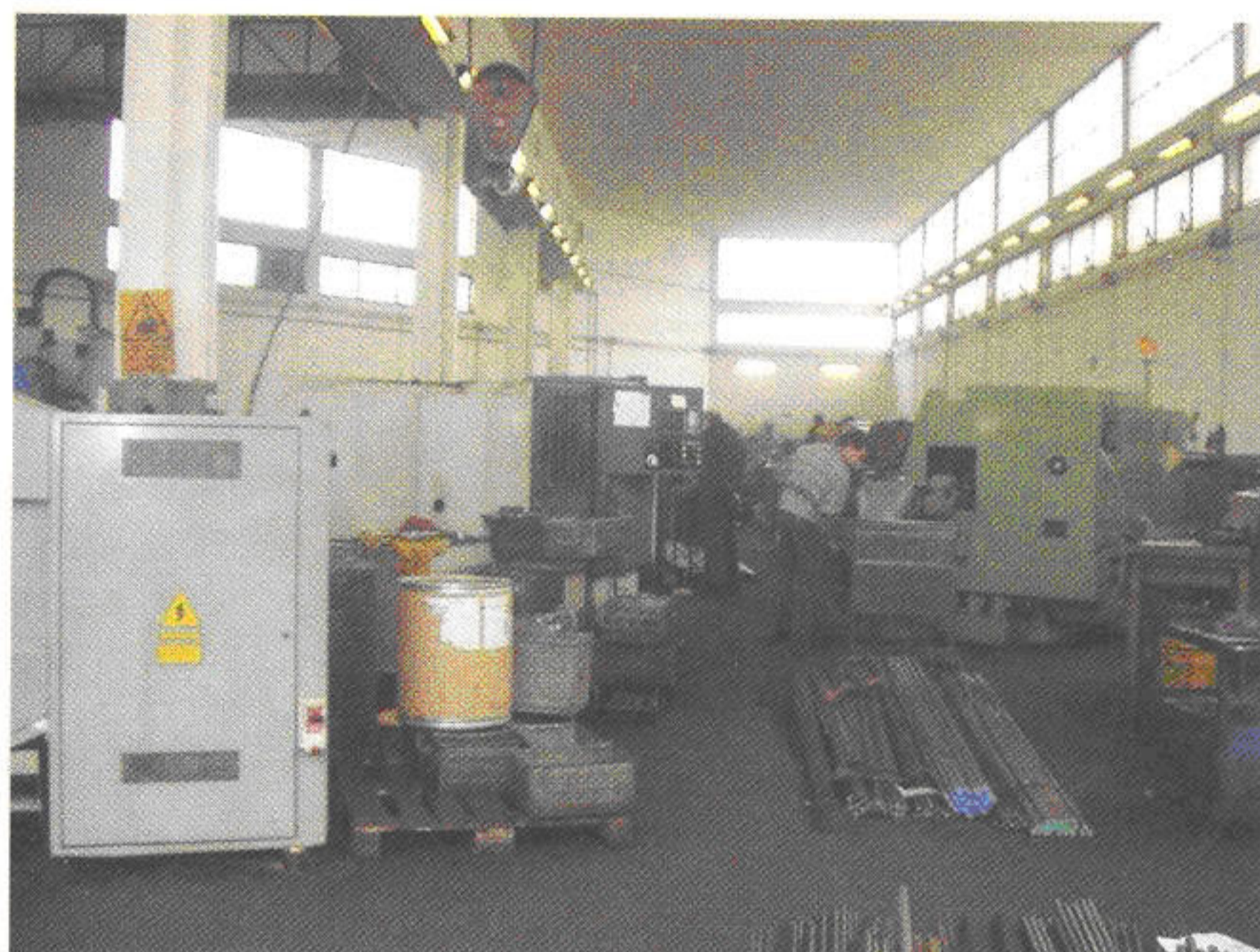
Vista interni dell'azienda O.M.P. Inside view of O.M.P. company.