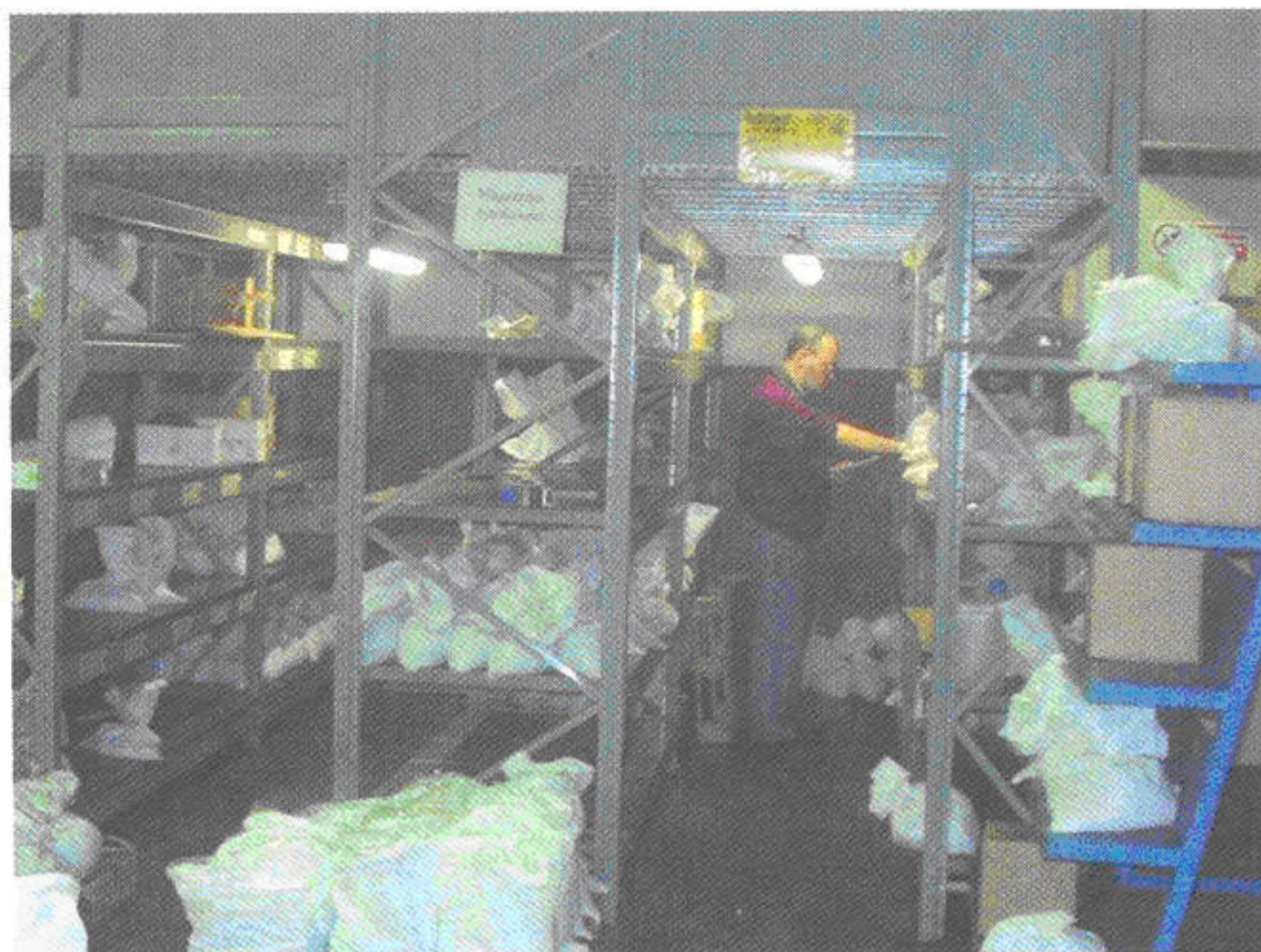
Il magazzino e il reparto spedizioni. The warehouse and forwarding department.

English version • English version • English version • English version • English version